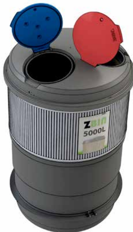
Z-Bin som dobbelt container med to sække til to affaldsfraktioner. Lågene kan leveres i forskellige farver, så det er nemt for brugeren at kende forskel på fraktionerne.

Tømning af Z-Bin foregår via toppen med krog-system eller gasfjederåbning. Proceduren er enkel og kan nemt udføres af én mand.